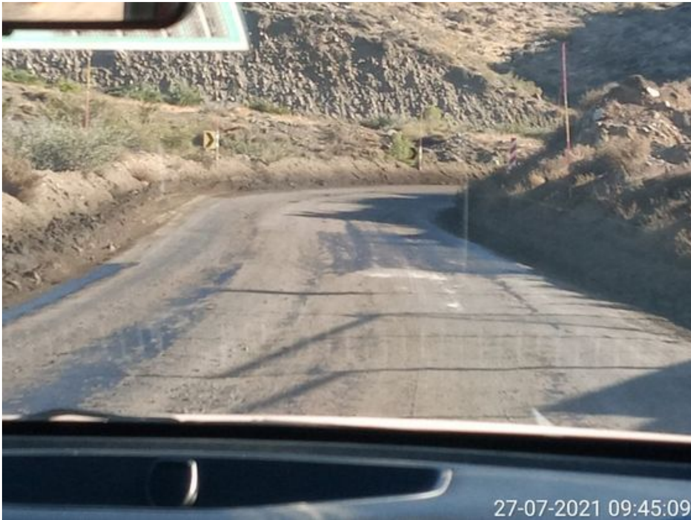
Foto 36: Medida: Aplicación Dust Control. Lugar: Chacay a Quillay. Comentarios: Camino con aplicación de producto operativo entre cortado