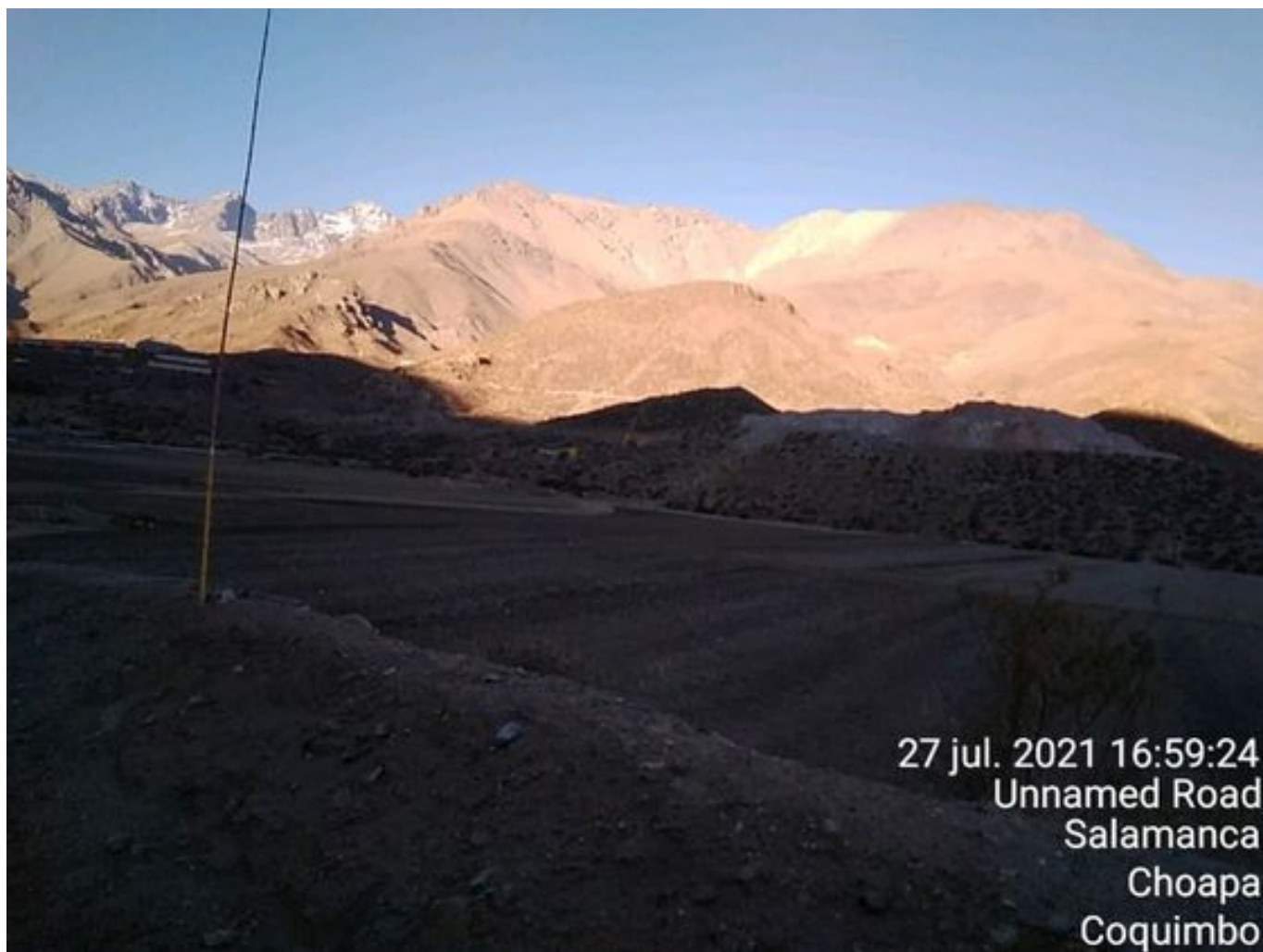
Foto 46: Medida: Aplicación de empréstito. Lugar: Sector Cola. Comentarios: no se observan trabajos en el área