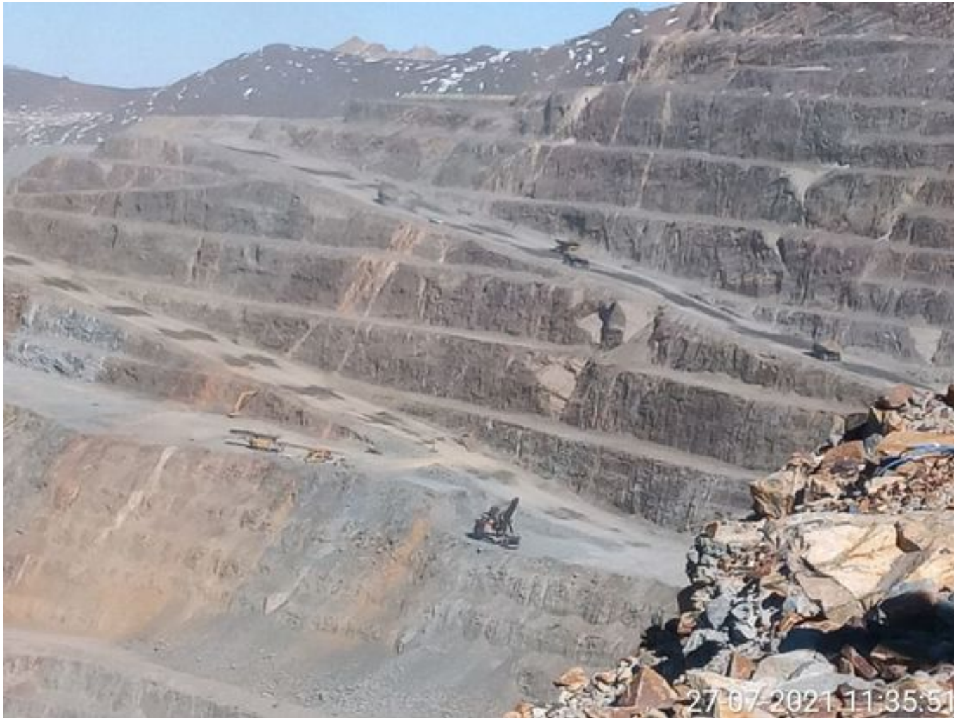
Foto 5: Medida: Riego de caminos. Lugar: Fases superiores. Comentarios: rampas con riego entre cortado 4x1 con 2 camiones aljibes besalco en pistas, medida de regadio no es suficiente para mitigar material particulado, fuentes de emisión equipos de carguío, tránsito de Caex, laderas y pretilas por fuertes ráfagas de viento levantando Bastante material particulado