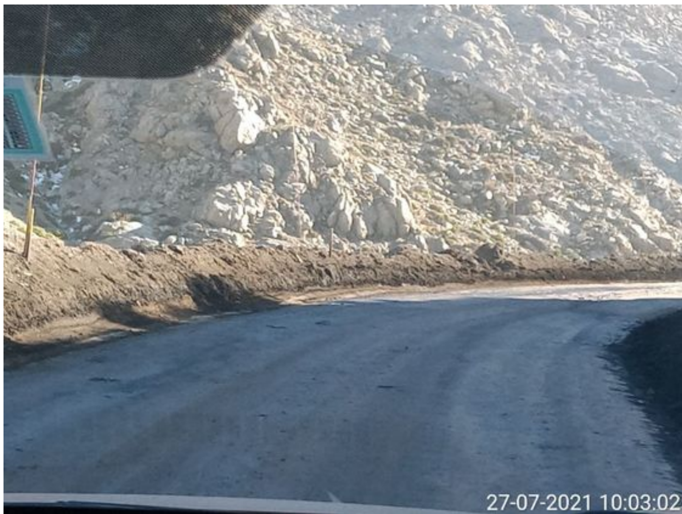
Foto 31: Medida: Aplicación de producto Corp. Vial. Lugar: Hotel Mina a Garita Mina. Comentarios: camino con aplicación de producto operativo entre cortado