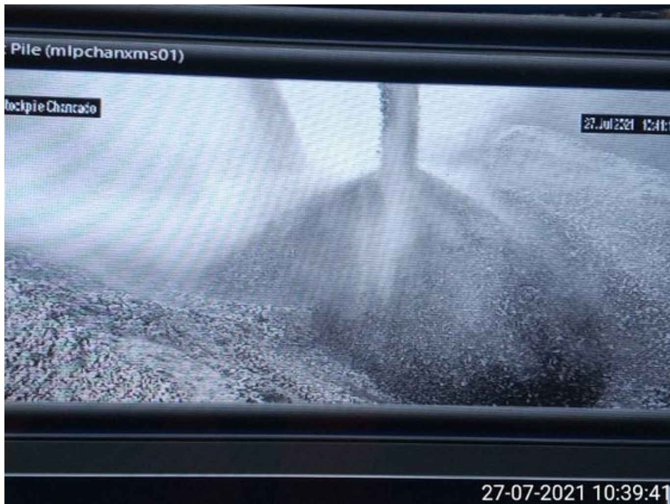
Foto 19: Medida: Espumante en Correas y Stock Pile. Lugar: Chancado 1. Comentarios: producto operativo TK 4.030 litros y ambas bombas al 20%