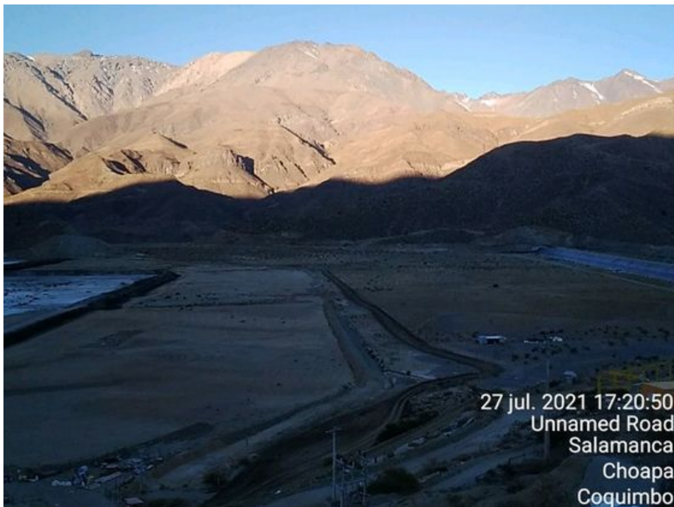
Foto 43: Medida: Aplicación de empréstito. Lugar: Sector Tranque. Comentarios: no se observan trabajos en el área