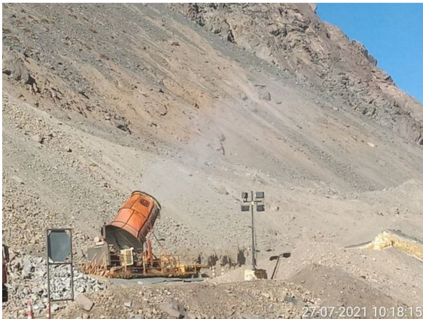
Foto 13: Medida: Fogcannon 2. Lugar: . Comentarios: equipo operativo