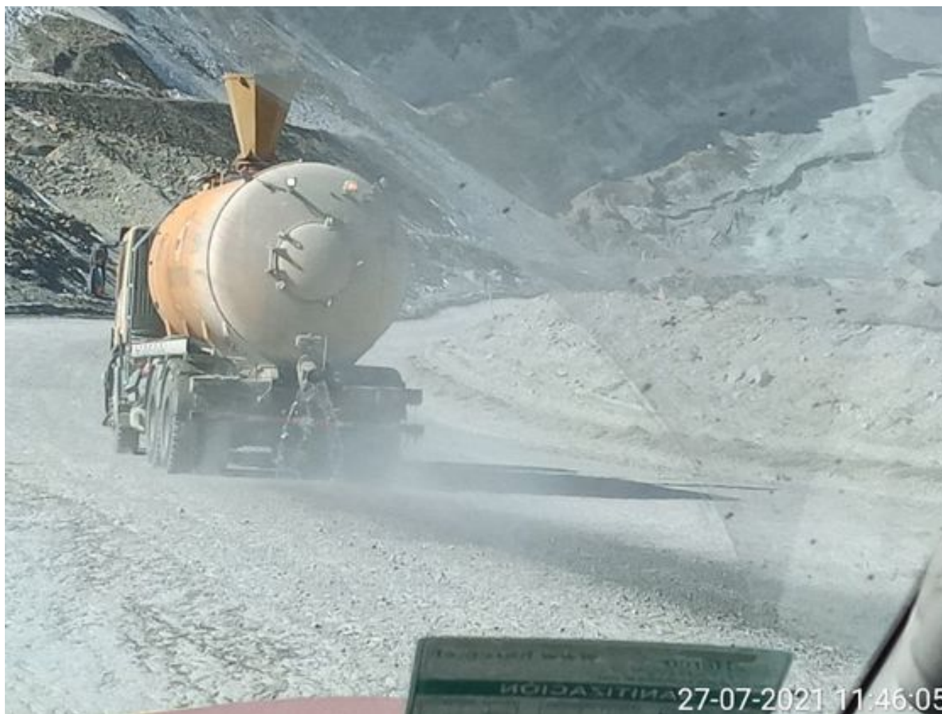
Foto 10: Medida: Riego de caminos EPSA Cerro Amarillo. Lugar: Fases superiores. Comentarios: rampas se encuentran con riego entre cortado pero al momento de la visita se encuentran detenidos por mp10 , en la visita se observa el camión epsa operativo pero con problemas en el aspersor de agua , no se ponen operativos