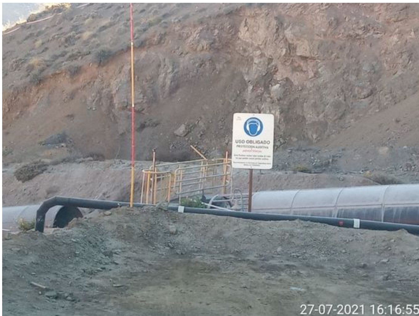
Foto 17: Medida: Regaderas en Correa Transportadora. Lugar: Salida túnel 3. Comentarios: correas detenidas por mantención programada de 4 hrs