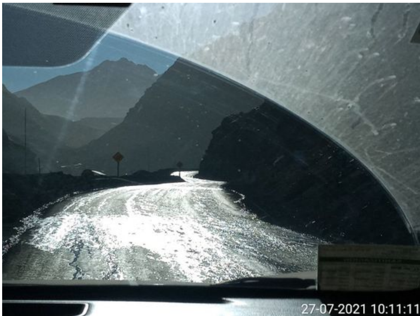
Foto 12: Medida: Aplicación anticongelante. Lugar: Caminos Interior Mina. Comentarios: anticongelante operativo