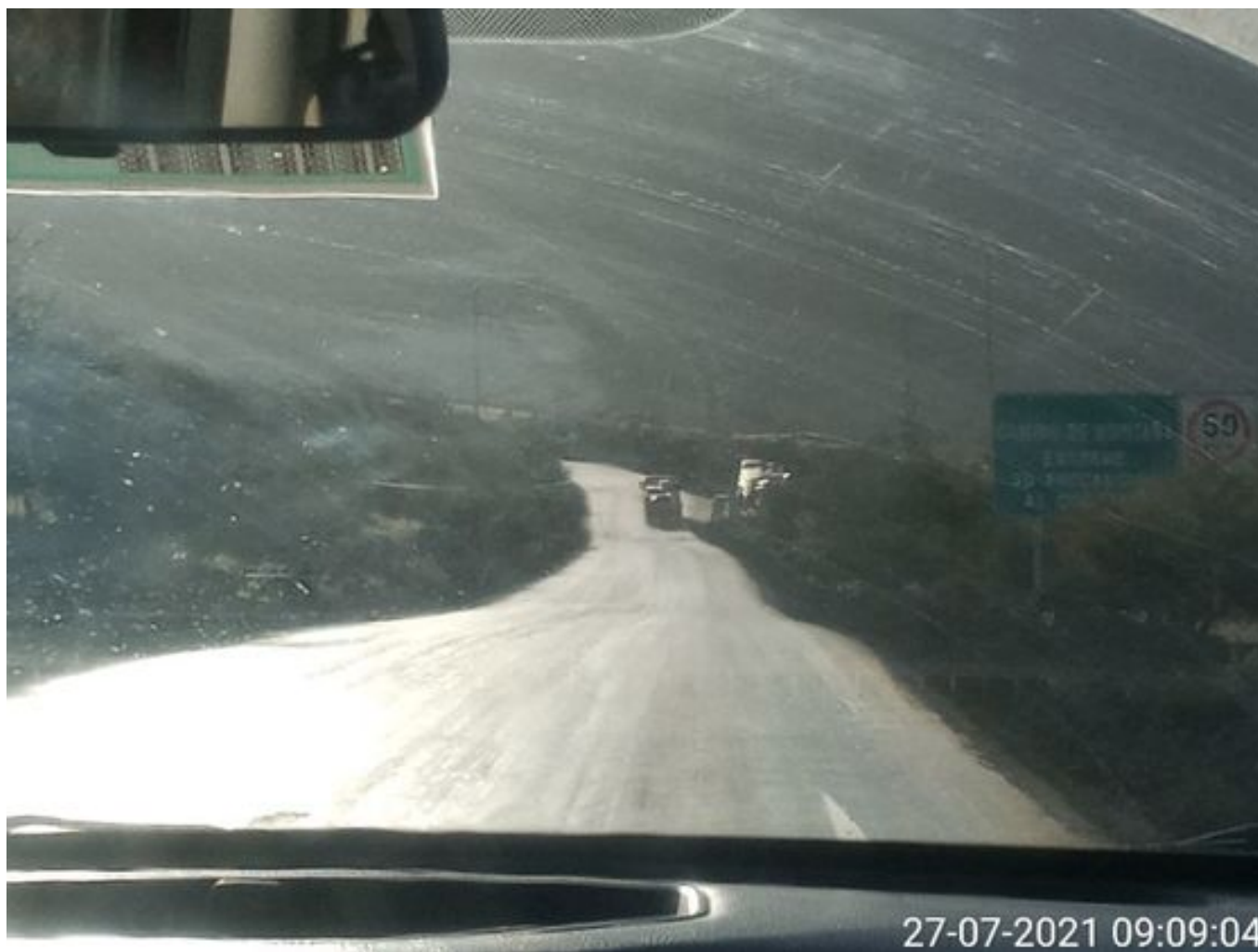
Foto 37: Medida: Aplicación Dust Control. Lugar: Portones a Chacay. Comentarios: camino con aplicación de producto operativo entre cortado