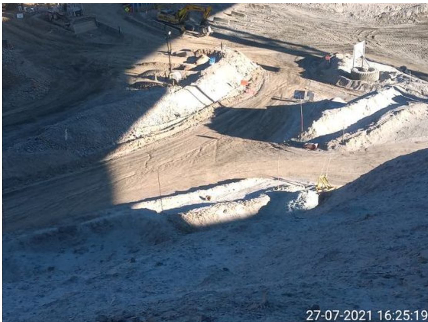
Foto 49: Medida: Riego Caminos. Lugar: Stock pile planta. Comentarios: riego de caminos operativo