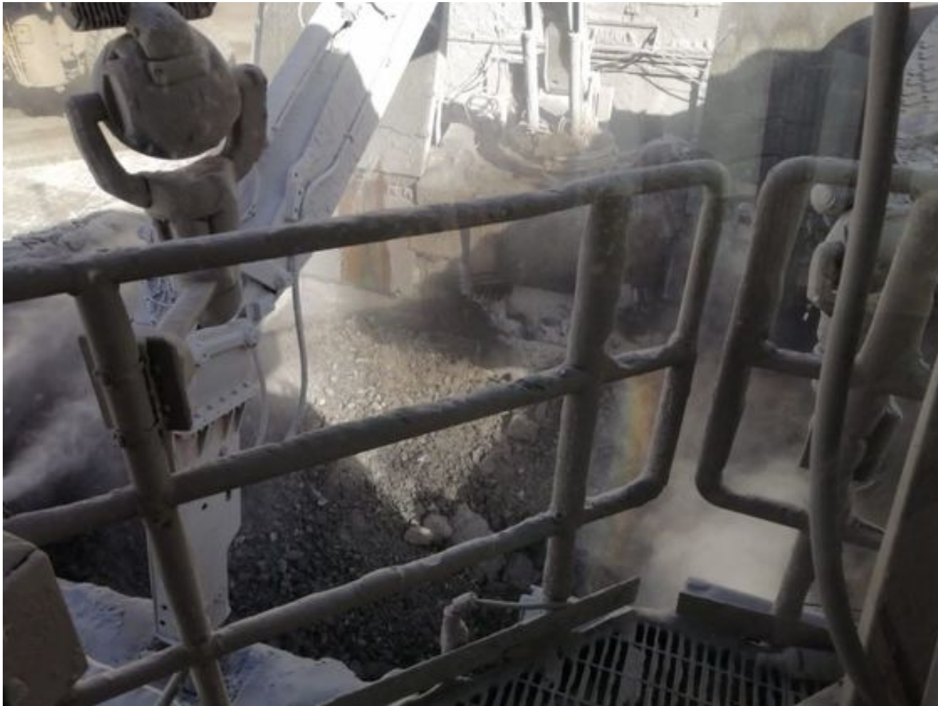
Foto 23: Medida: Supresor de polvo. Lugar: Taza Chancado 1. Comentarios: supresores se observan operativos pero medida no es suficiente para mitigar material particulado en descarga de caex en taza de chancado