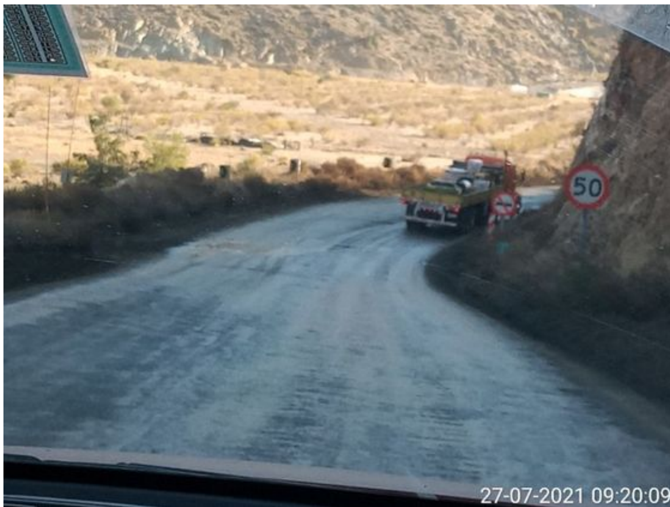
Foto 38: Medida: Aplicación Dust Control. Lugar: Portones a Chacay. Comentarios: camino con aplicación de producto operativo entre cortado