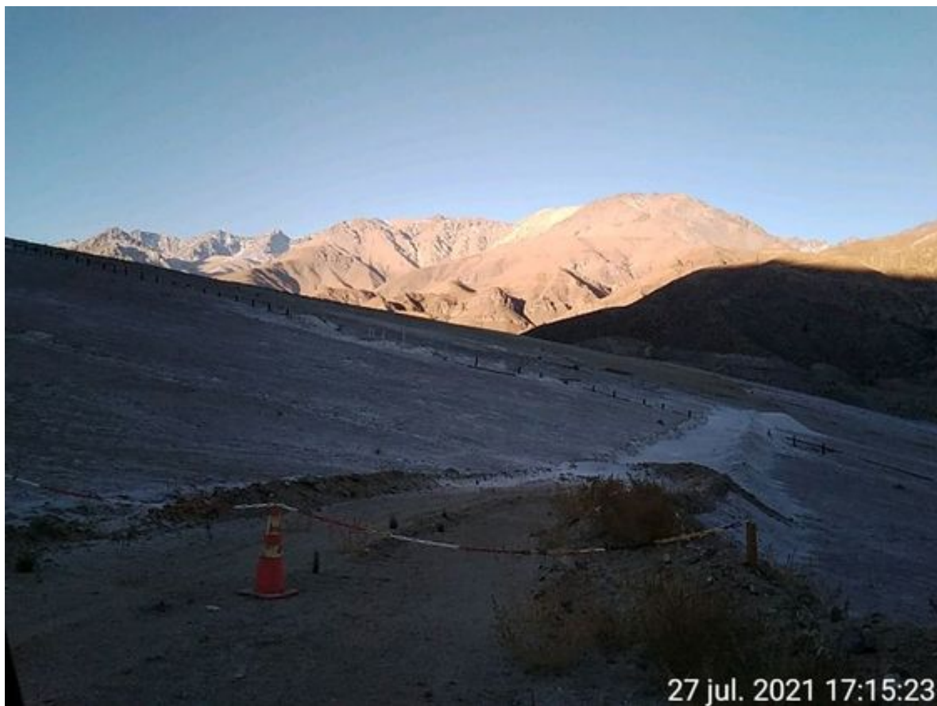
Foto 41: Medida: Aplicación de supresor. Lugar: Sector Muro. Comentarios: no se observan trabajos en el área