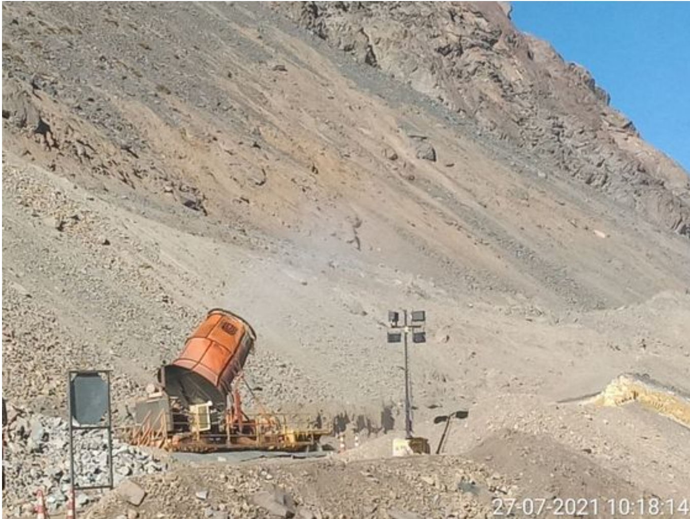
Foto 14: Medida: Fogcannon 2. Lugar: . Comentarios: equipo operativo