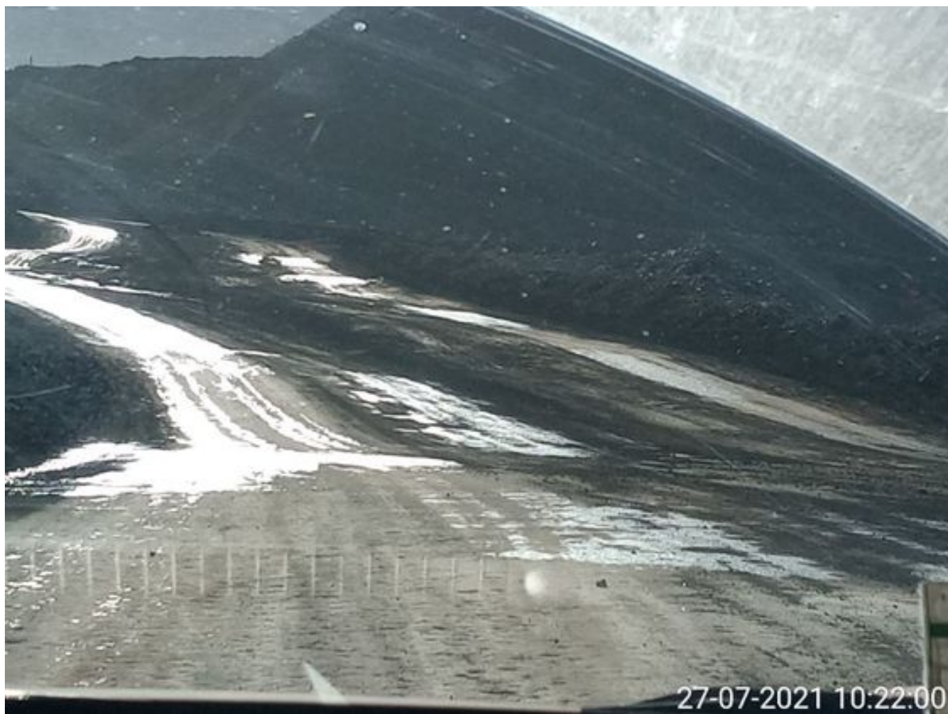
Foto 11: Medida: Aplicación anticongelante. Lugar: Caminos Interior Mina. Comentarios: anticongelante operativo