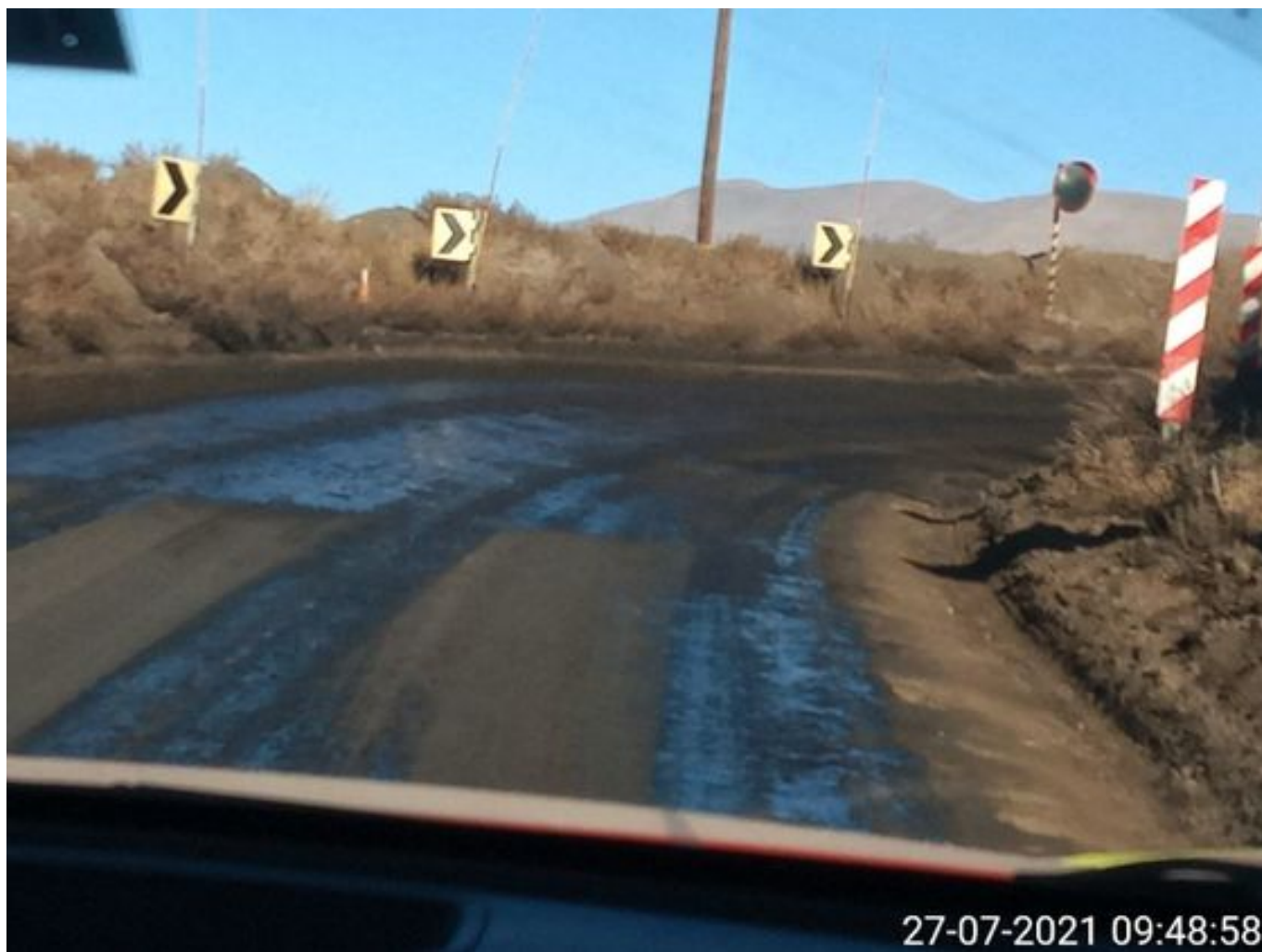
Foto 35: Medida: Aplicación Dust Control. Lugar: Chacay a Quillay. Comentarios: Camino con aplicación de producto operativo entre cortado