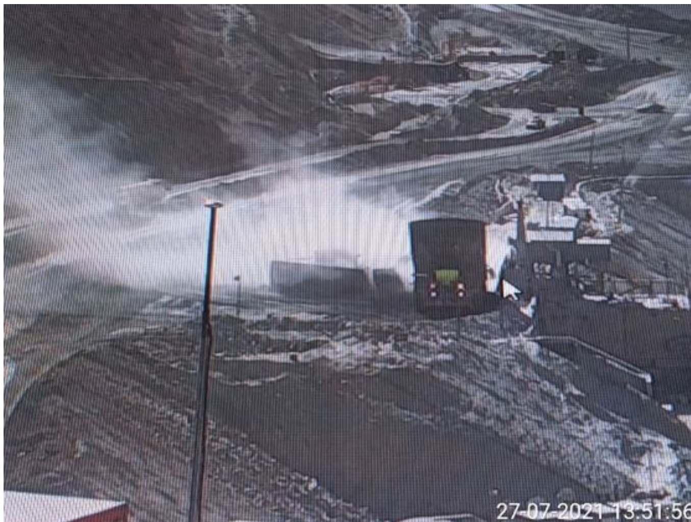
Foto 21: Medida: Supresor de polvo. Lugar: Taza Chancado 2. Comentarios: Supresores se observan operativos pero medida no es suficiente para mitigar material particulado en descarga de caex en taza de chancado