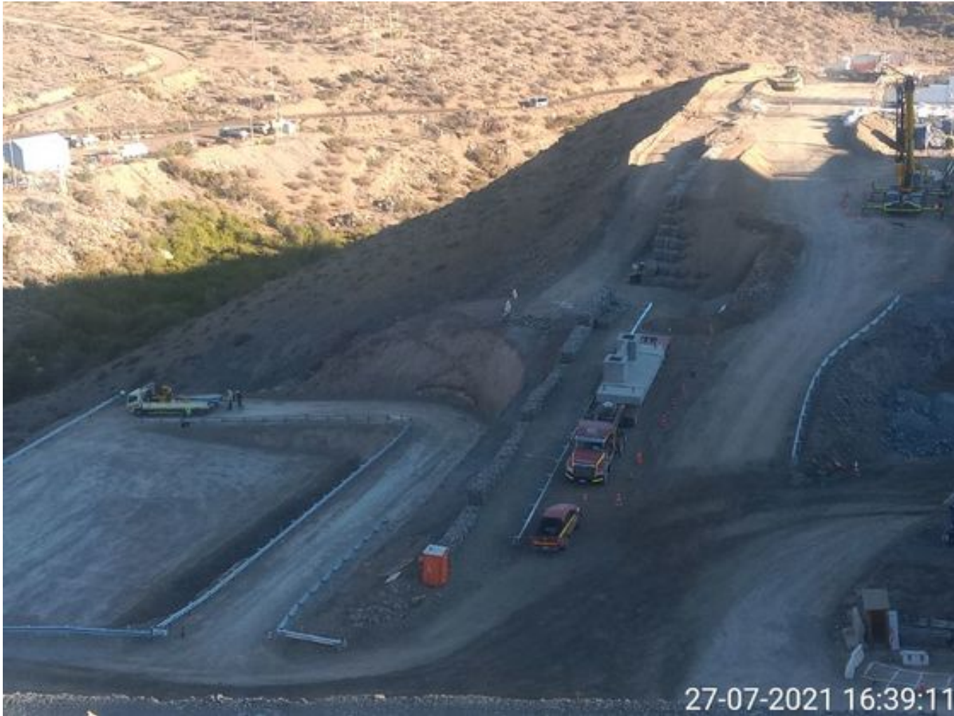
Foto 51: Medida: Riego de caminos en frentes de trabajo. Lugar: INCO. Comentarios: caminos con riego operativo 1 camion bechtel humectando