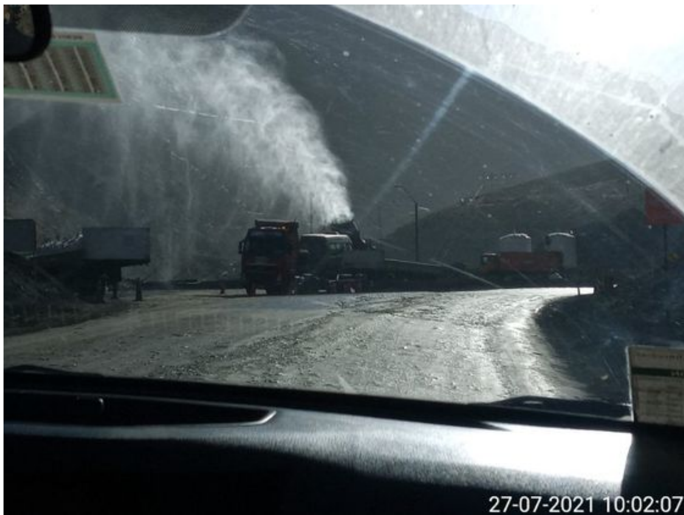
Foto 8: Medida: Fogcannon 1. Lugar: . Comentarios: equipo operativo