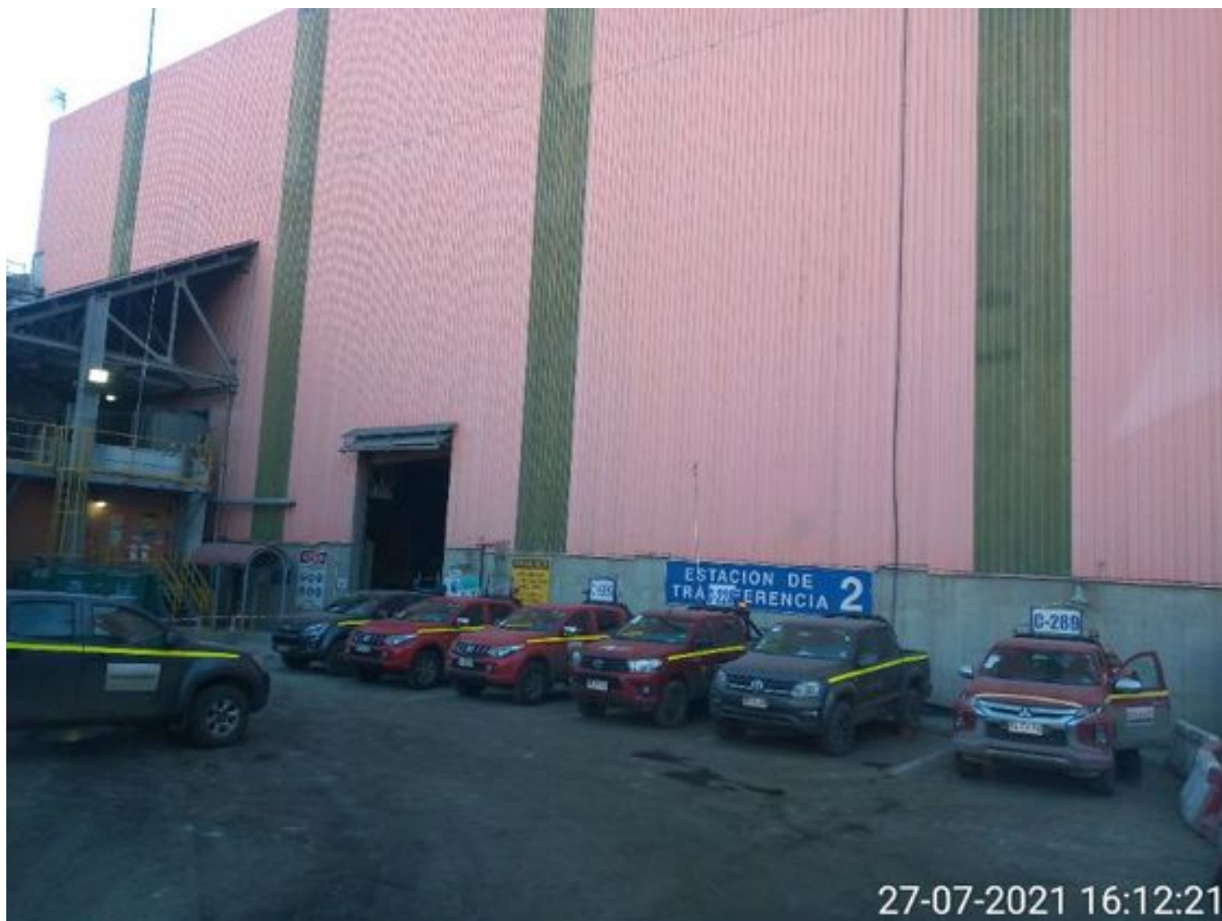
Foto 16: Medida: Aplicación Espuma Surfactante. Lugar: Correa CV 007. Comentarios: correas detenidas por mantención programada de 4 hrs