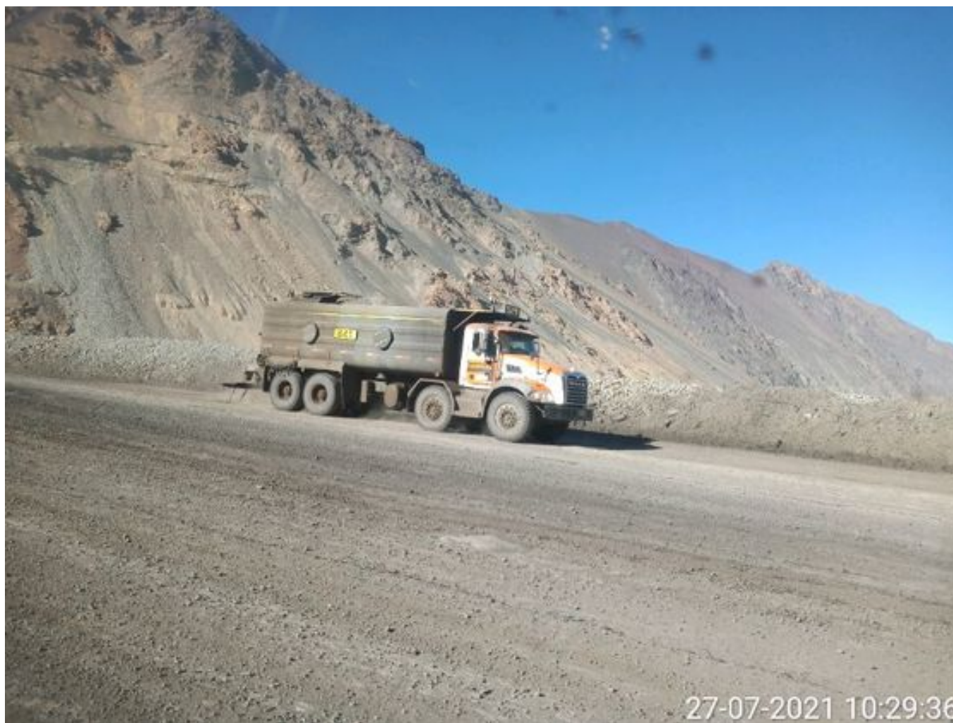
Foto 4: Medida: Riego de caminos. Lugar: Fases Inferiores. Comentarios: rampas con aplicación de producto operativo entre cortado con 3 camiones dast en circuito y 1 camion backup , botaderos se encuentran detenidos por mp10