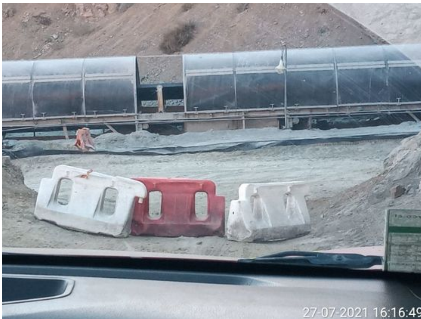
Foto 18: Medida: Regaderas en Correa Transportadora. Lugar: Salida túnel 3. Comentarios: correas detenidas por mantención programada de 4 hrs