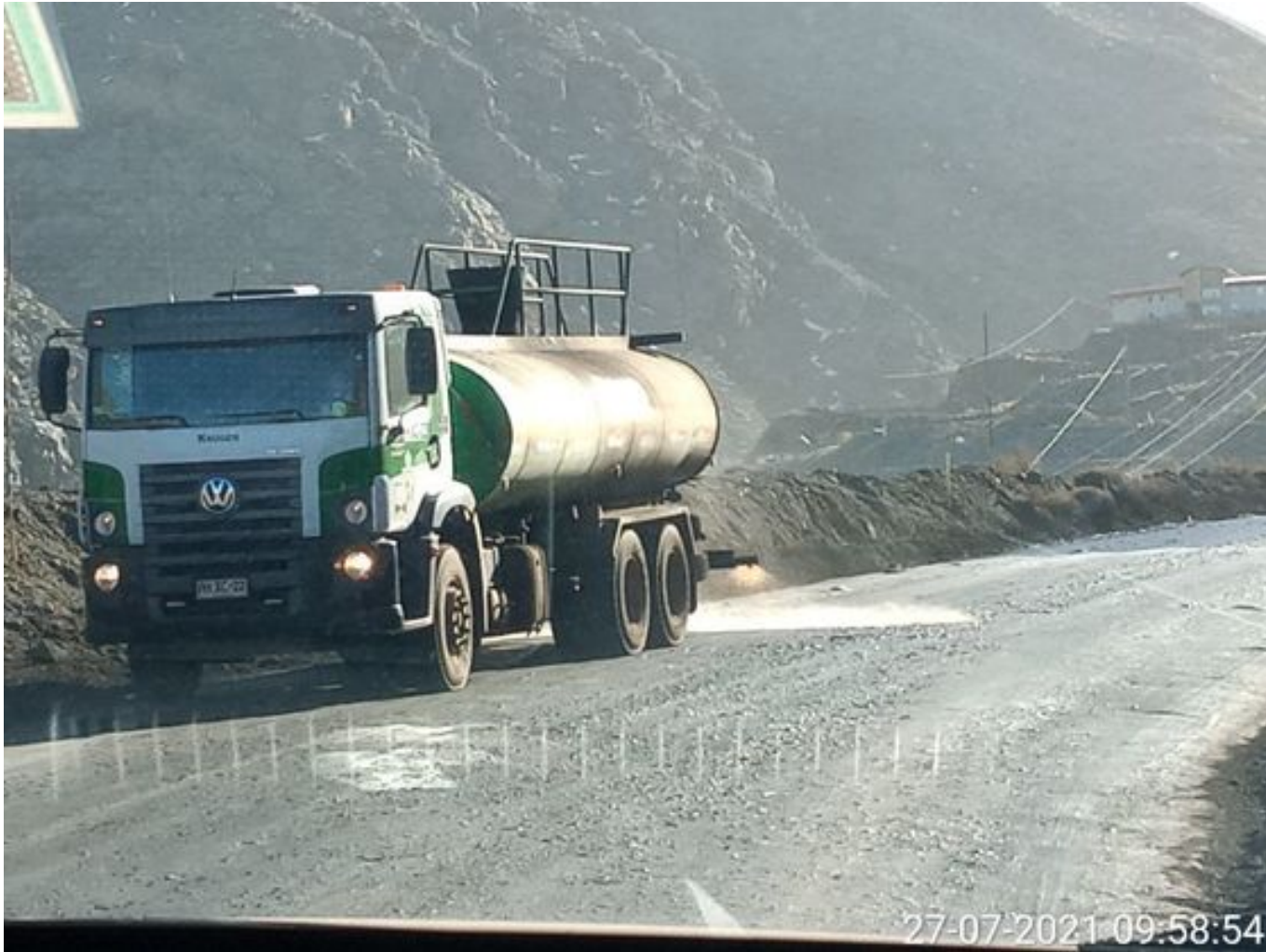
Foto 34: Medida: Aplicación Dust Control. Lugar: Quillay a Hotel Mina. Comentarios: camino con aplicación de producto operativo entre cortado