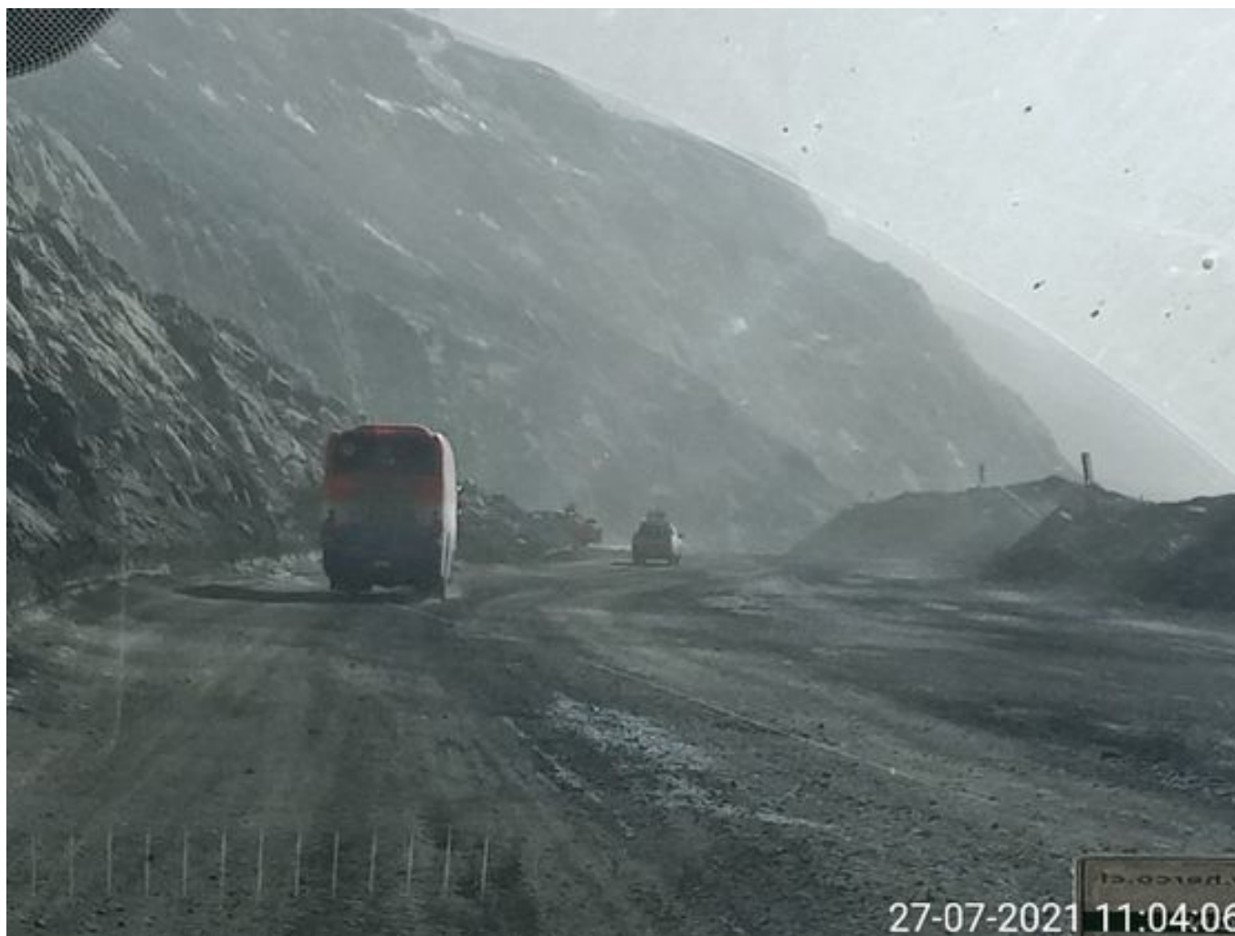
Foto 1: Medida: Riego de caminos. Lugar: Fases Intermedias. Comentarios: rampas con riego y aplicación de producto operativo entre cortado 3x1 con 1 camion aljibe besalco operativo , 1 camion das presta apoyo en toda la rampa oeste , medida de regadio no es suficiente para mitigar material particulado, fuentes de emisión tránsito de Caex, equipos de carguío, descarga de caex en taza de chancado , se observa bastante material particulado en la mina