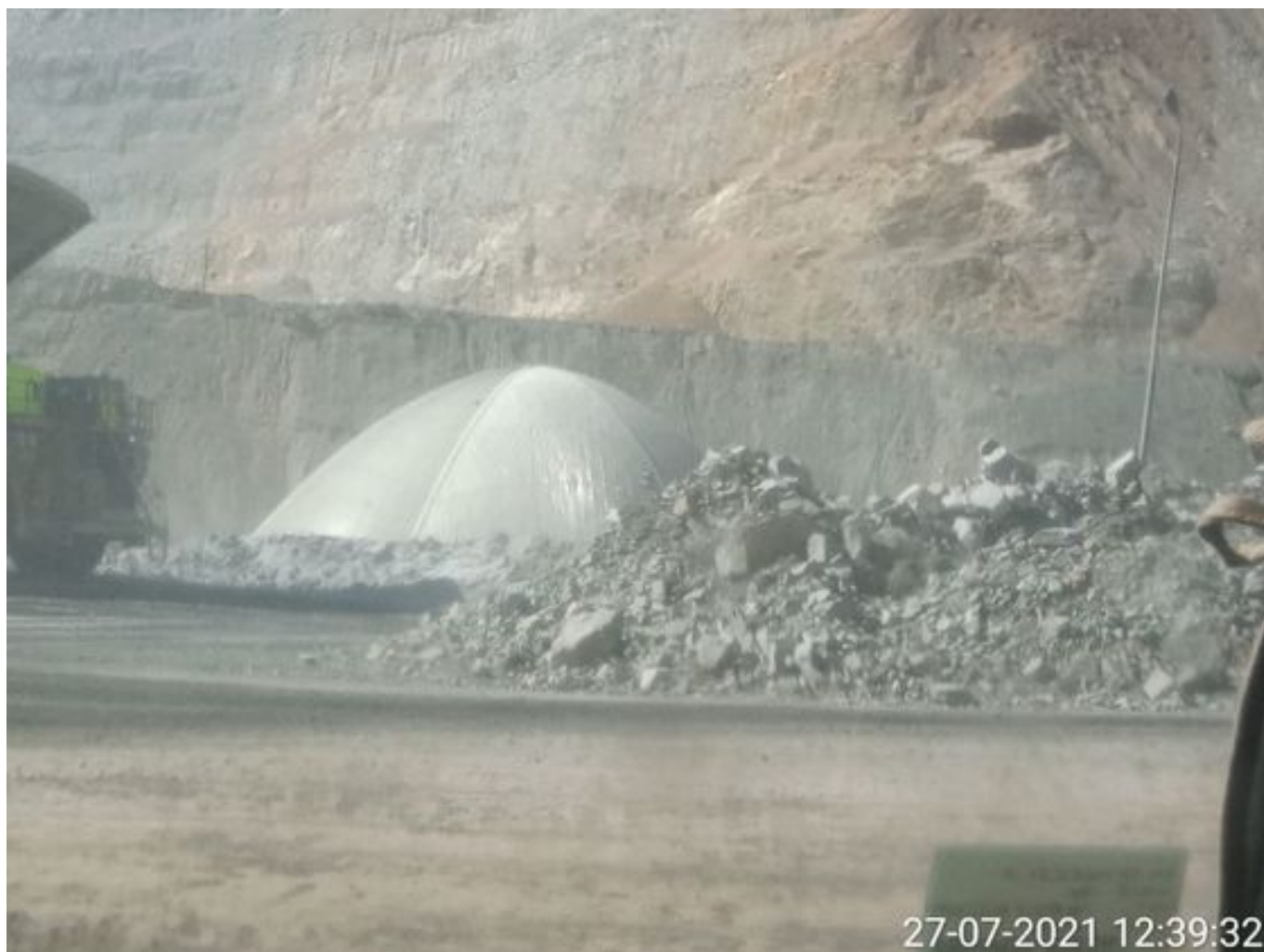
Foto 28: Medida: Espumante en Correas y Stock Pile. Lugar: Chancado 2. Comentarios: producto operativo no se observa material particulado fuera del domo