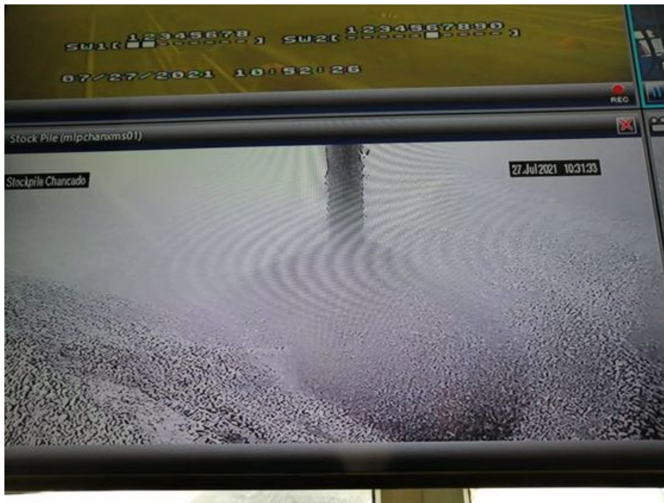
Foto 27: Medida: Espumante en Correas y Stock Pile. Lugar: Chancado 2. Comentarios: producto operativo no se observa material particulado fuera del domo