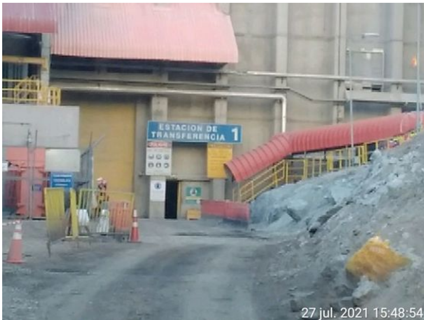
Foto 26: Medida: Regaderas. Lugar: TP1. Comentarios: correas detenidas por mantención programada de 4 hrs