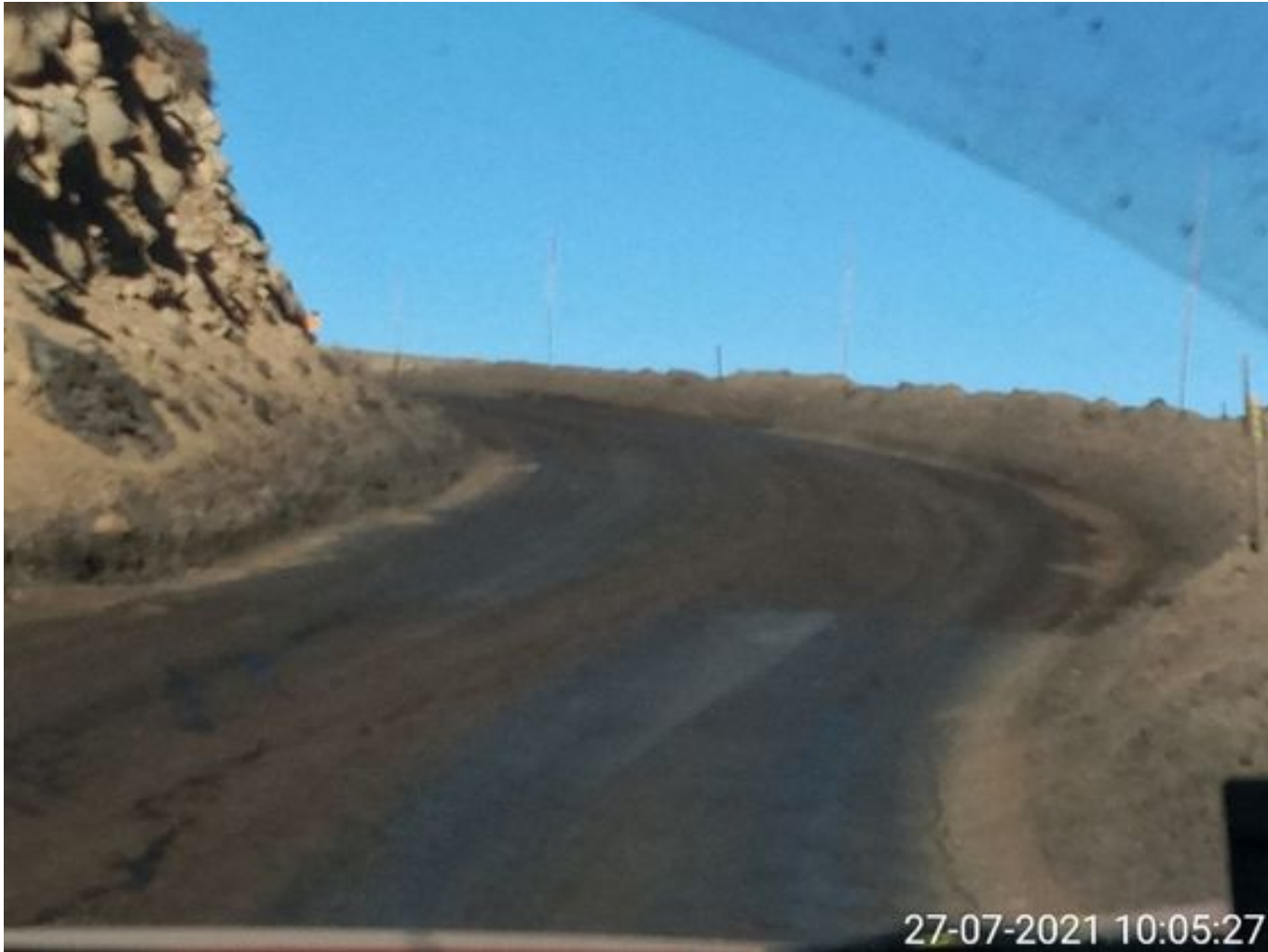
Foto 32: Medida: Aplicación de producto Corp. Vial. Lugar: Hotel Mina a Garita Mina. Comentarios: camino con aplicación de producto operativo entre cortado