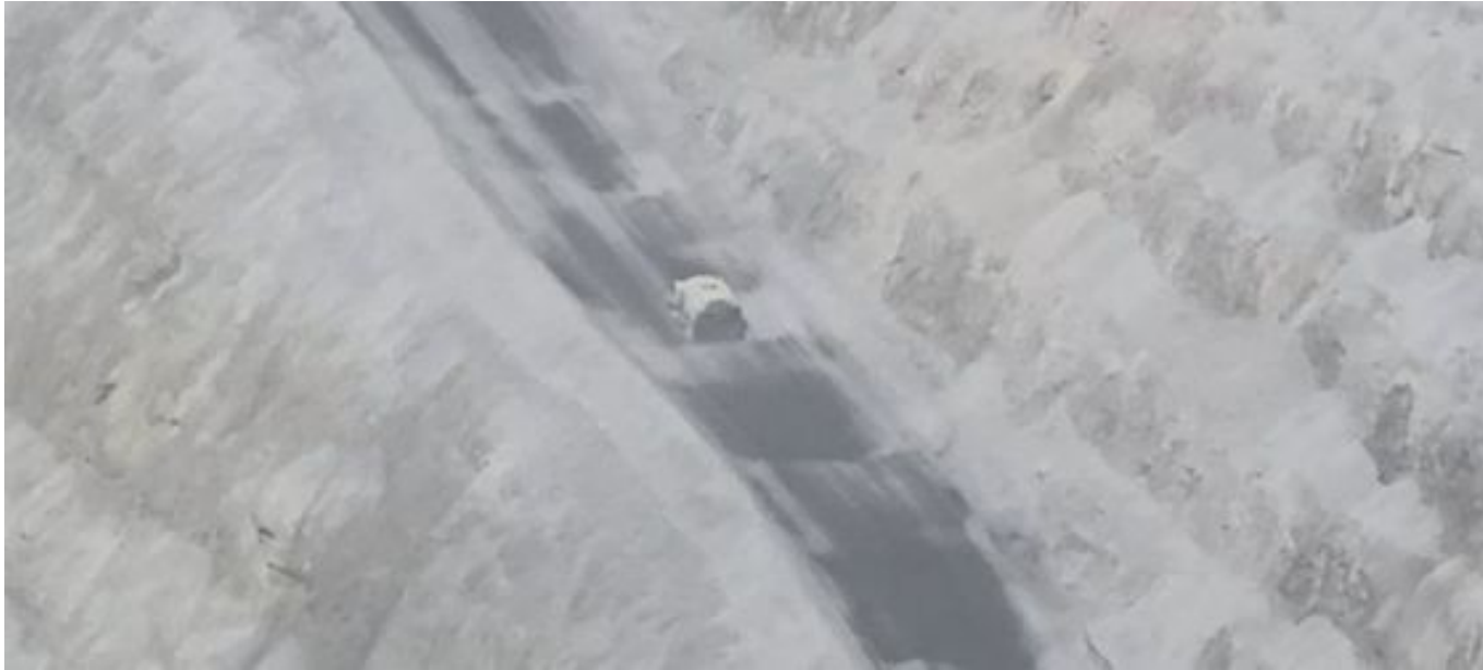
Foto 2: Medida: Riego de caminos. Lugar: Fases Intermedias. Comentarios: rampas con riego y aplicación de producto operativo entre cortado 3x1 con 1 camion aljibe besalco operativo , 1 camion das presta apoyo en toda la rampa oeste , medida de regadio no es suficiente para mitigar material particulado, fuentes de emisión tránsito de Caex, equipos de carguío, descarga de caex en taza de chancado , se observa bastante material particulado en la mina