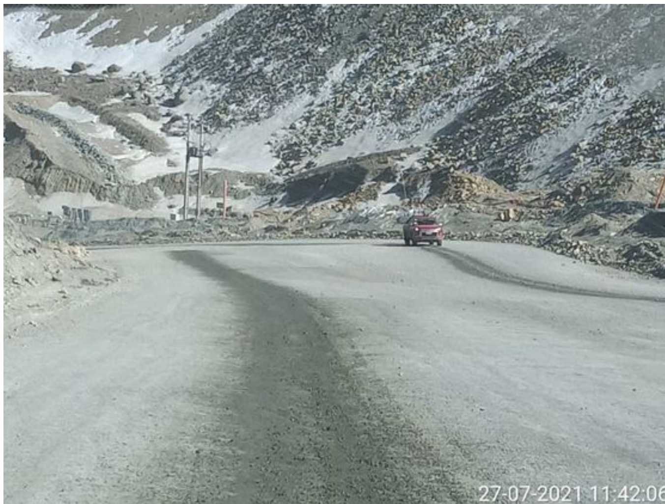
Foto 9: Medida: Riego de caminos EPSA Cerro Amarillo. Lugar: Fases superiores. Comentarios: rampas se encuentran con riego entre cortado pero al momento de la visita se encuentran detenidos por mp10 , en la visita se observa el camión epsa operativo pero con problemas en el aspersor de agua , no se ponen operativos