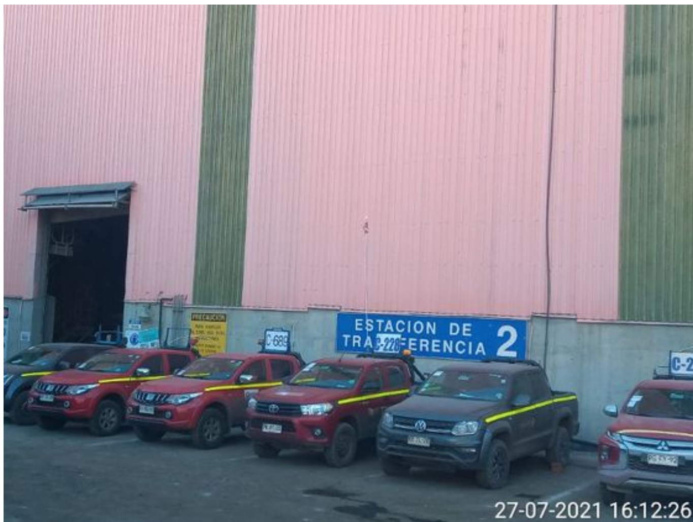
Foto 25: Medida: Regaderas. Lugar: TP2. Comentarios: correas detenidas por mantención programada por 4 hrs