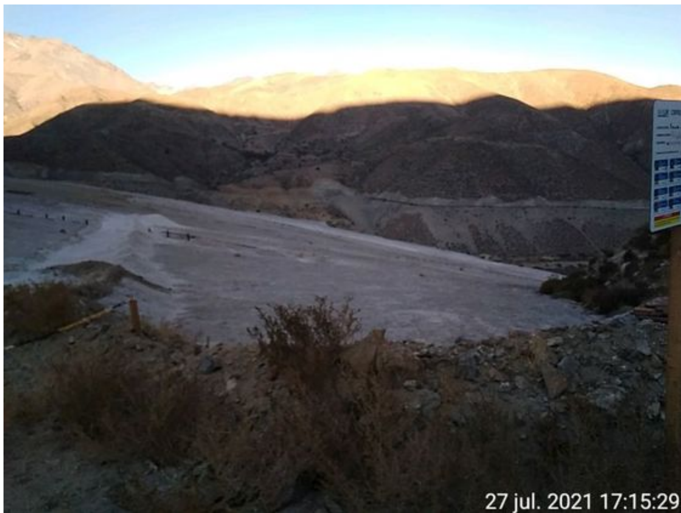
Foto 40: Medida: Aplicación de supresor. Lugar: Sector Muro. Comentarios: no se observan trabajos en el área