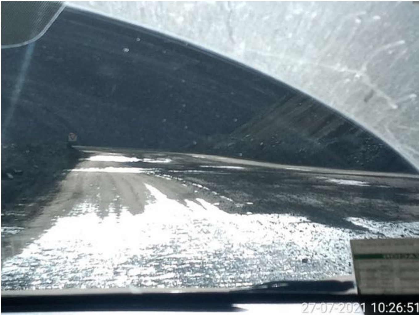
Foto 3: Medida: Riego de caminos. Lugar: Fases Inferiores. Comentarios: rampas con aplicación de producto operativo entre cortado con 3 camiones dast en circuito y 1 camion backup , botaderos se encuentran detenidos por mp10