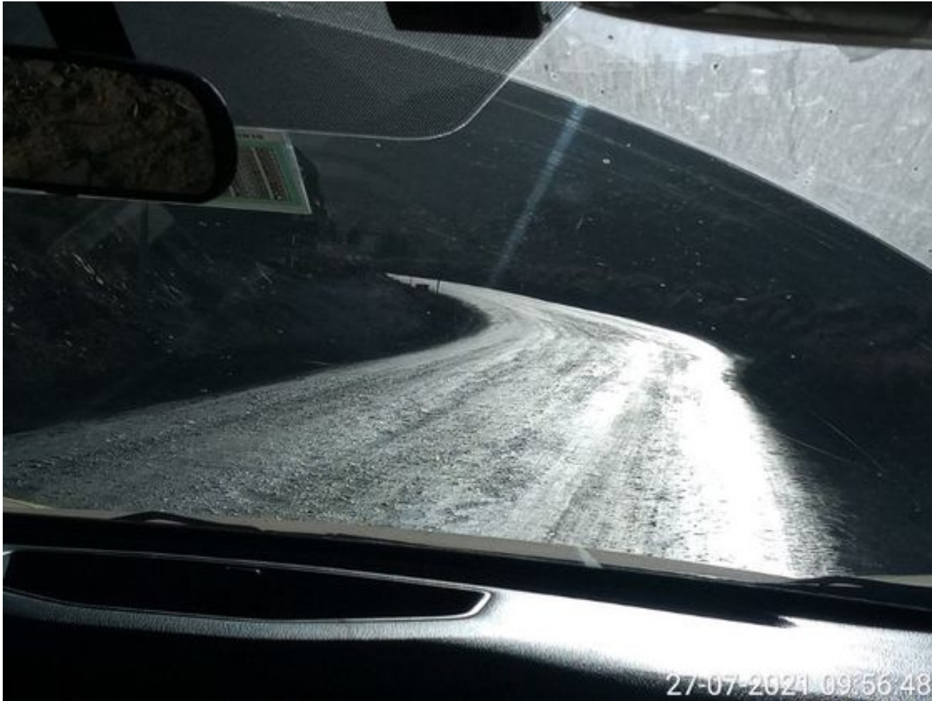
Foto 33: Medida: Aplicación Dust Control. Lugar: Quillay a Hotel Mina. Comentarios: camino con aplicación de producto operativo entre cortado