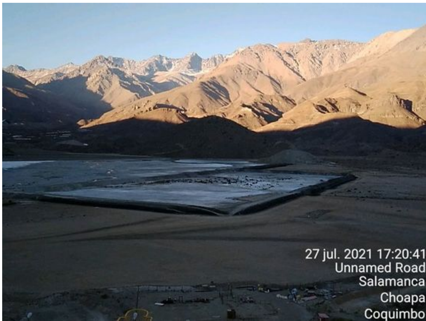
Foto 42: Medida: Aplicación de empréstito. Lugar: Sector Tranque. Comentarios: no se observan trabajos en el área