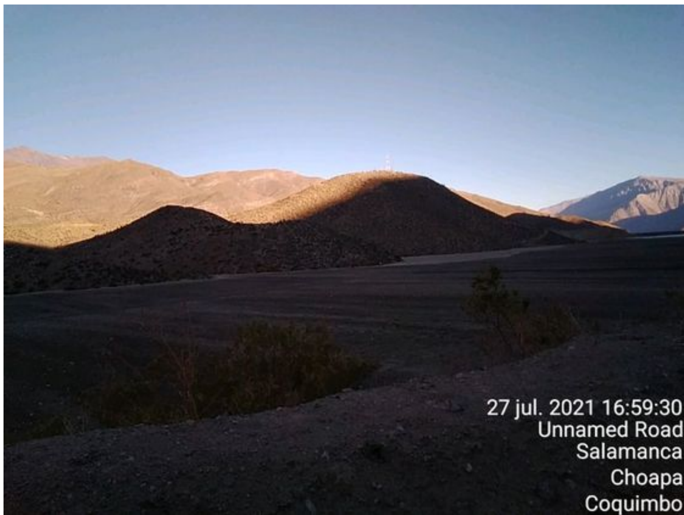
Foto 45: Medida: Aplicación de empréstito. Lugar: Sector Cola. Comentarios: no se observan trabajos en el área