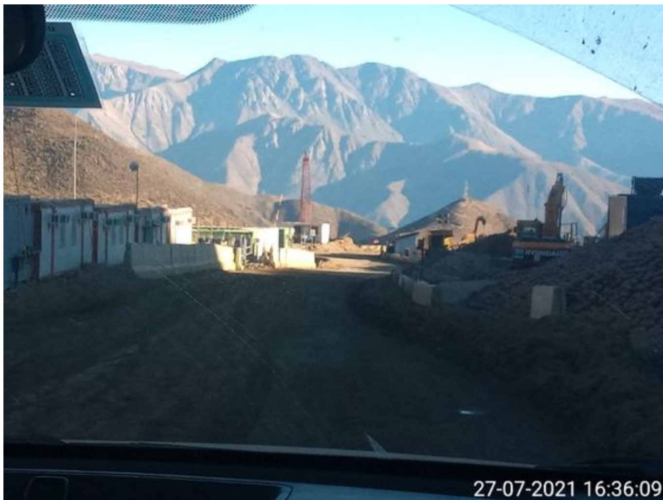
Foto 52: Medida: Riego de caminos en frentes de trabajo. Lugar: INCO. Comentarios: caminos con riego operativo 1 camion bechtel humectando