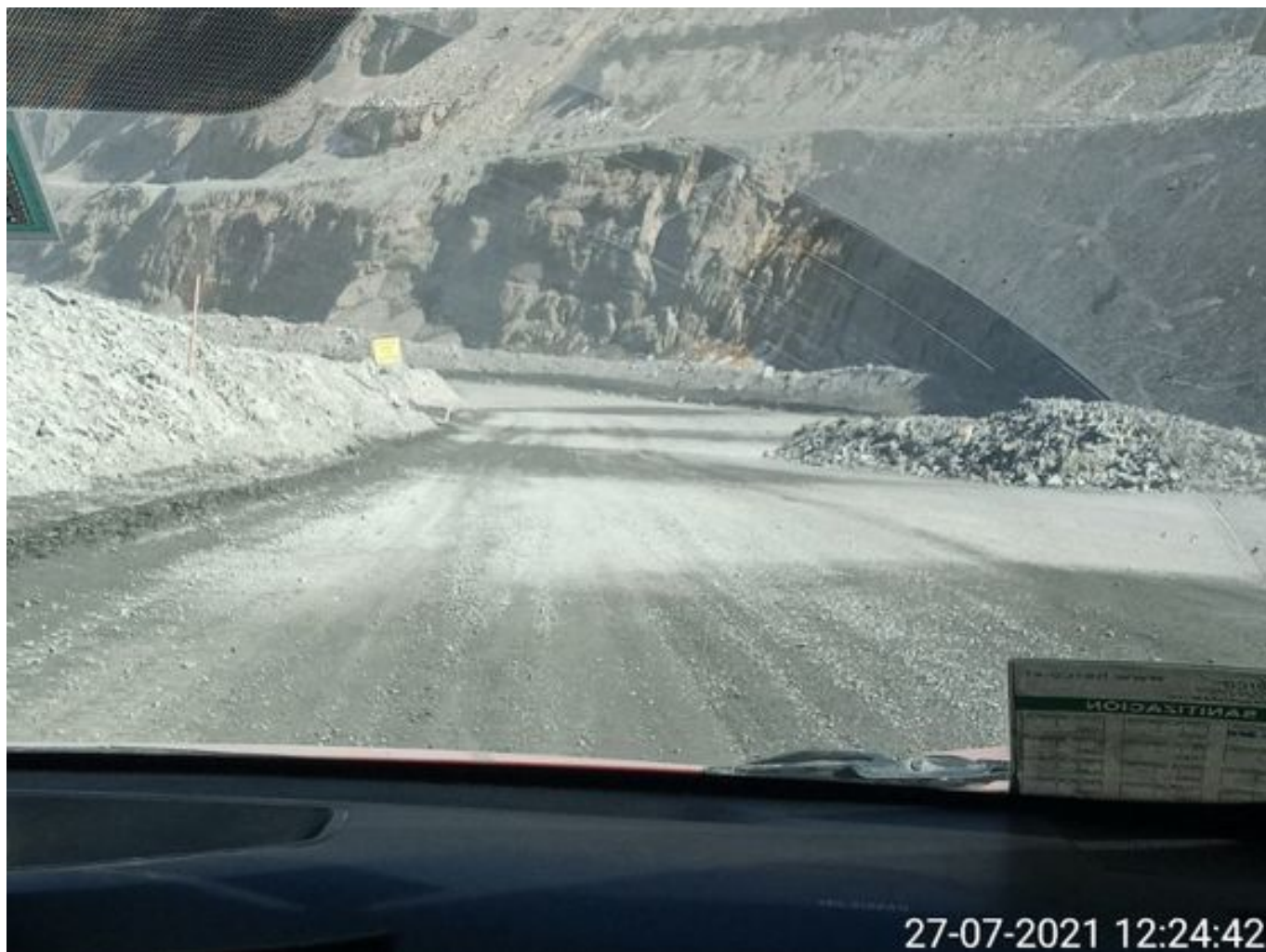
Foto 6: Medida: Riego de caminos. Lugar: Fases superiores. Comentarios: rampas con riego entre cortado 4x1 con 2 camiones aljibes besalco en pistas, medida de regadio no es suficiente para mitigar material particulado, fuentes de emisión equipos de carguío, tránsito de Caex, laderas y pretiles por fuertes ráfagas de viento levantando Bastante material particulado