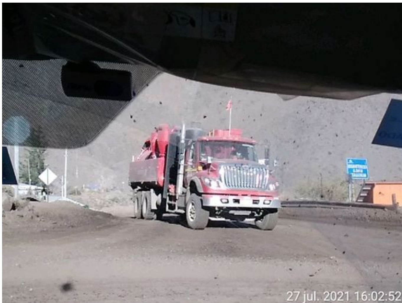
Foto 15: Medida: Limpieza con camión super sucker. Lugar: Chancado y correas. Comentarios: equipo operativo