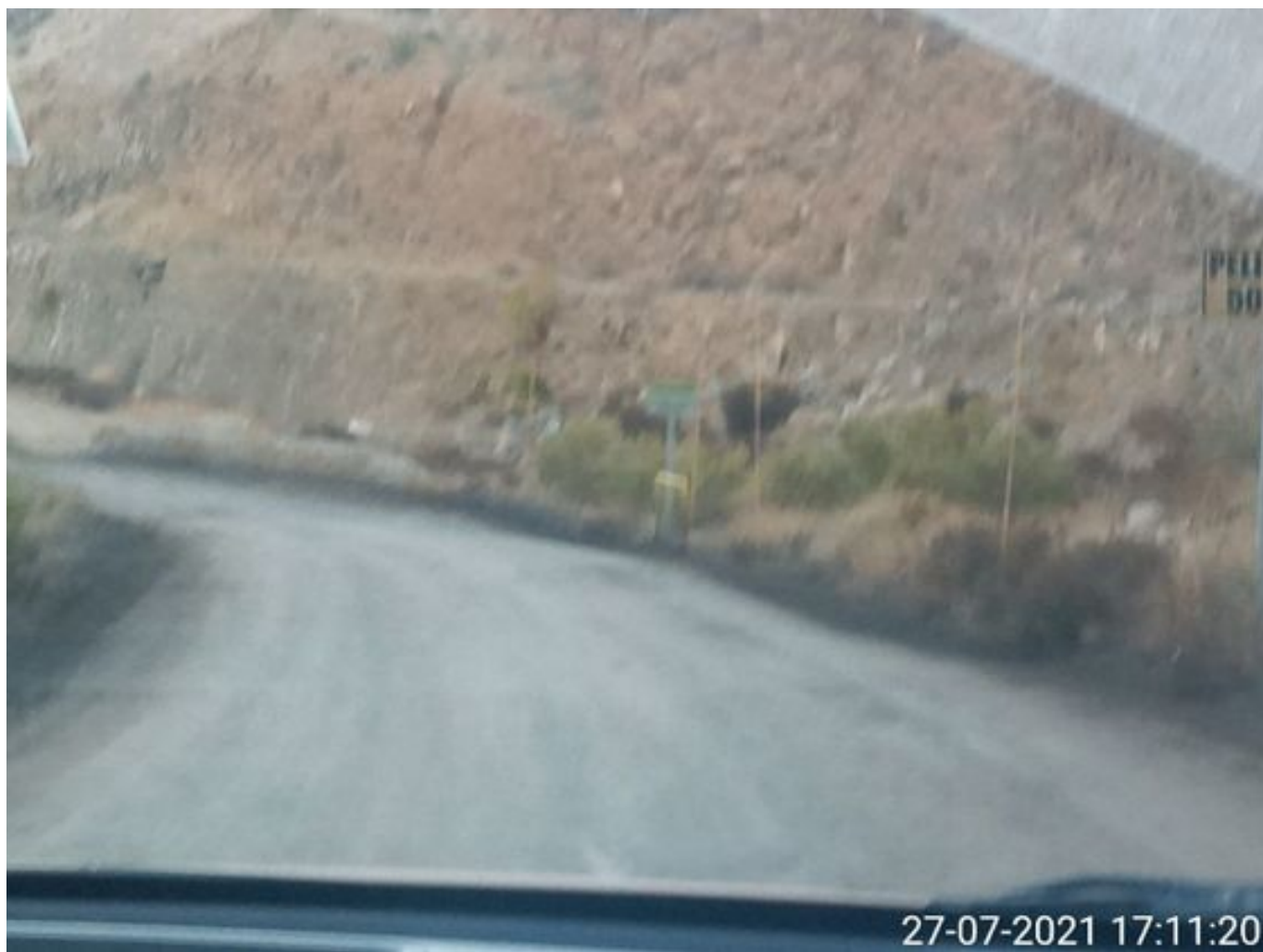
Foto 30: Medida: Aplicación Dust Control camino alternativo. Lugar: Estribo derecho Tranque Quillayes. Comentarios: camino con aplicación de producto operativo