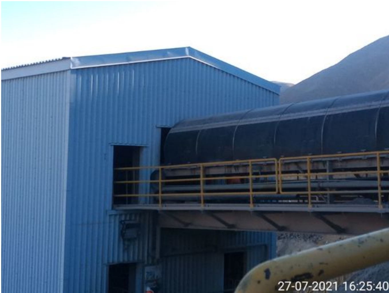
Foto 48: Medida: Regaderas. Lugar: Descarga stock pile planta. Comentarios: correas detenidas por mantención programada de 4 hrs