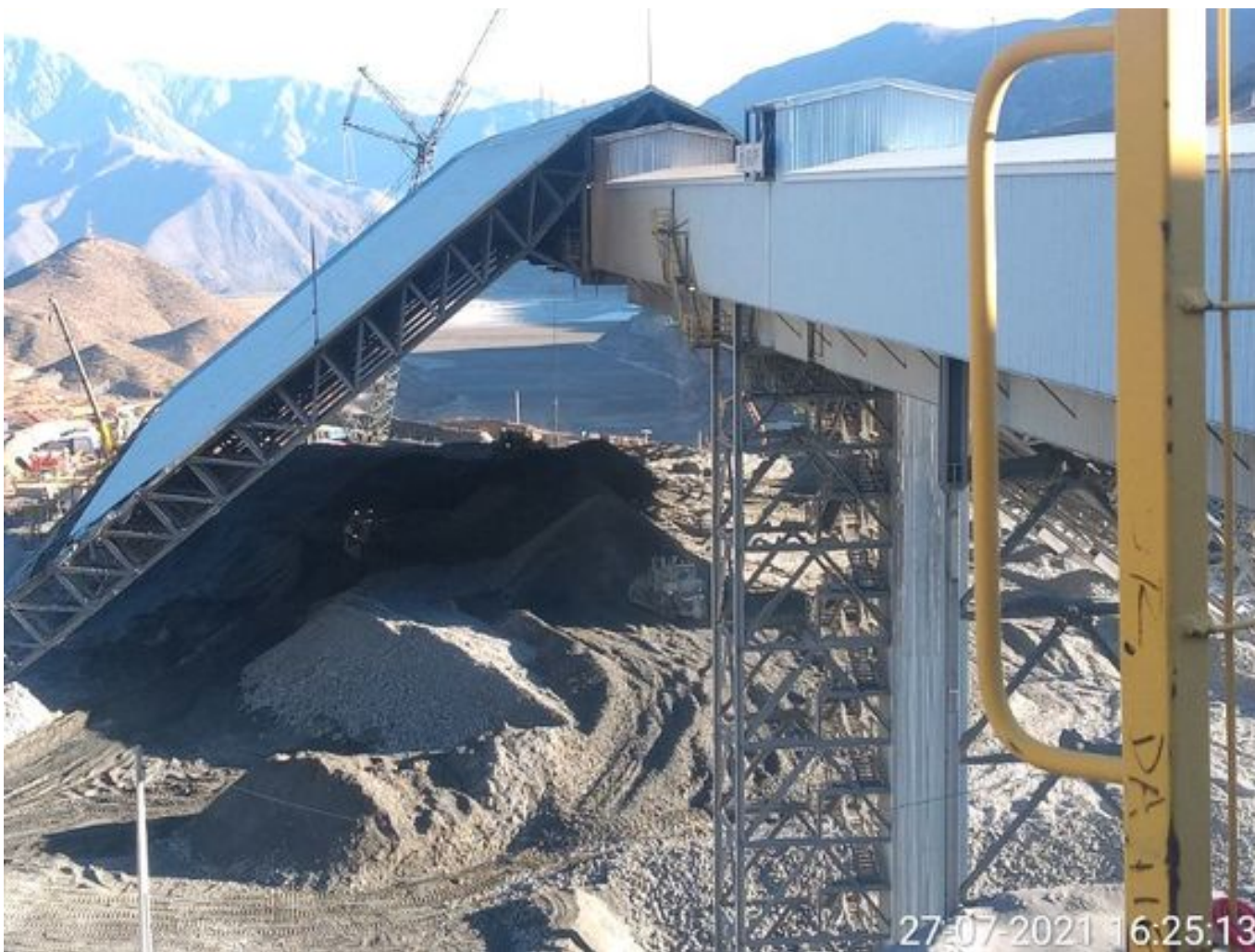
Foto 47: Medida: Regaderas. Lugar: Descarga stock pile planta. Comentarios: correas detenidas por mantención programada de 4 hrs