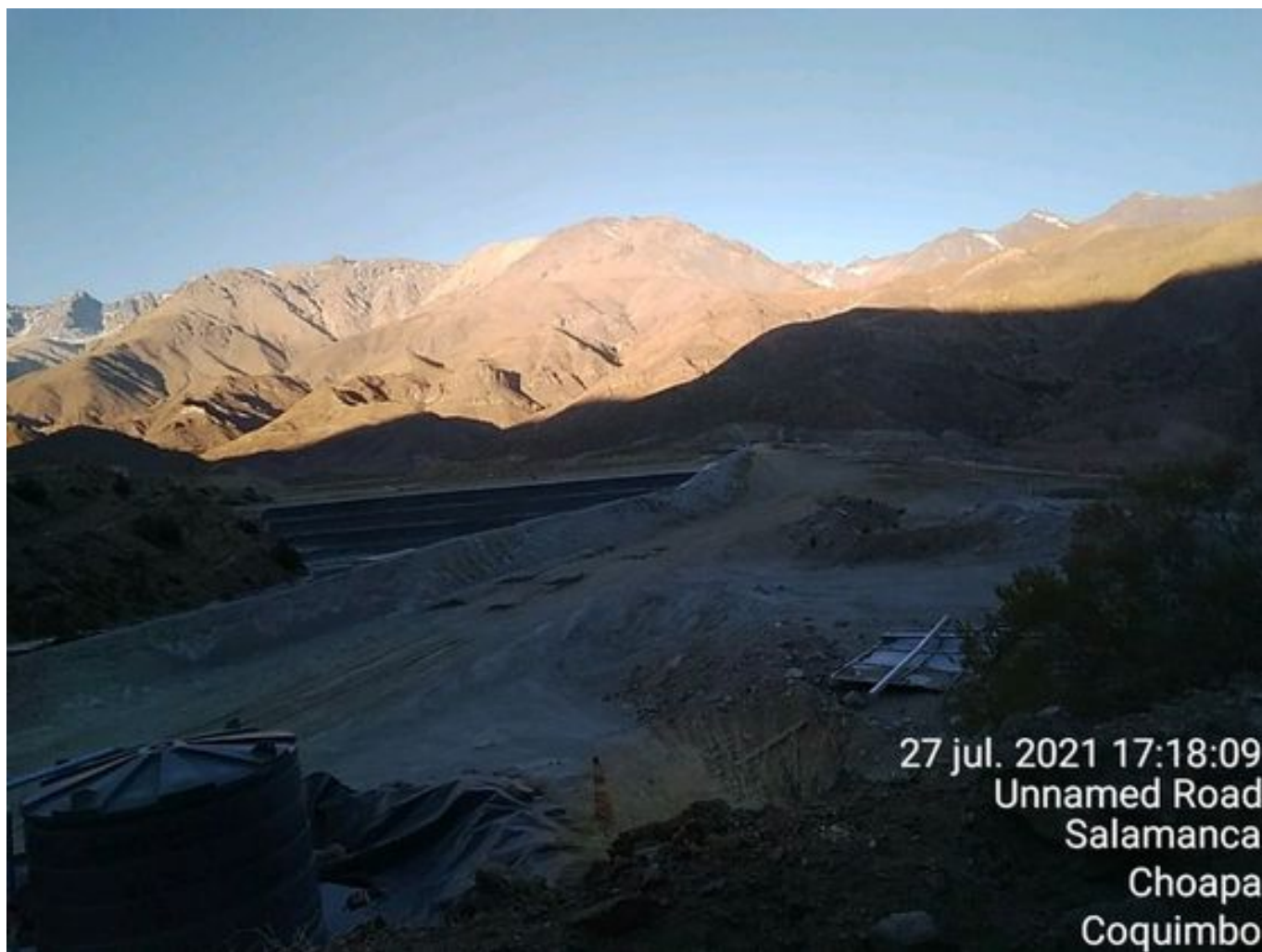
Foto 44: Medida: Aplicación Soiltiac coronamiento del muro. Lugar: Tranque Quillayes. Comentarios: no se observan trabajos en el área