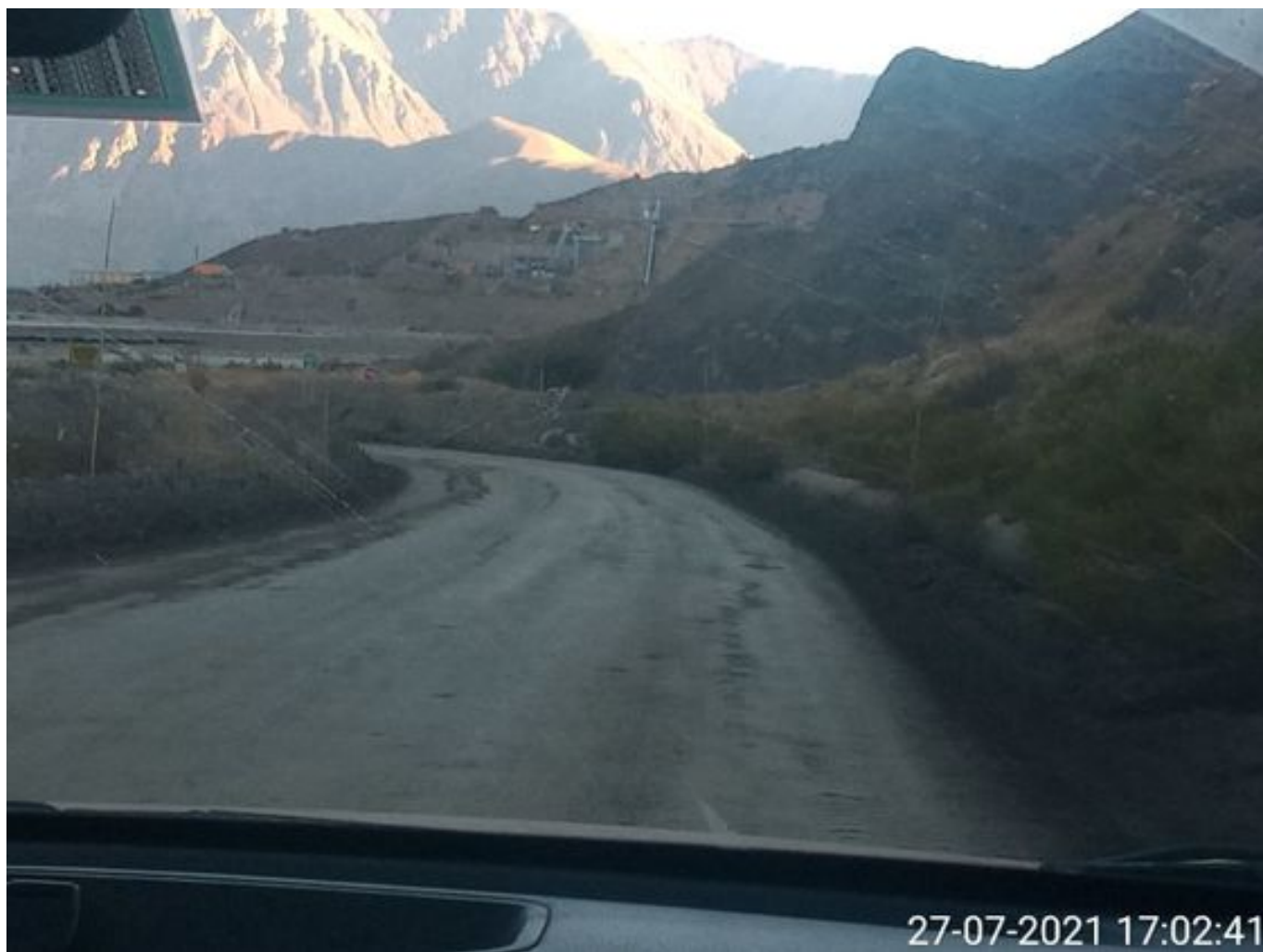
Foto 29: Medida: Aplicación Dust Control camino alternativo. Lugar: Estribo derecho Tranque Quillayes. Comentarios: camino con aplicación de producto operativo