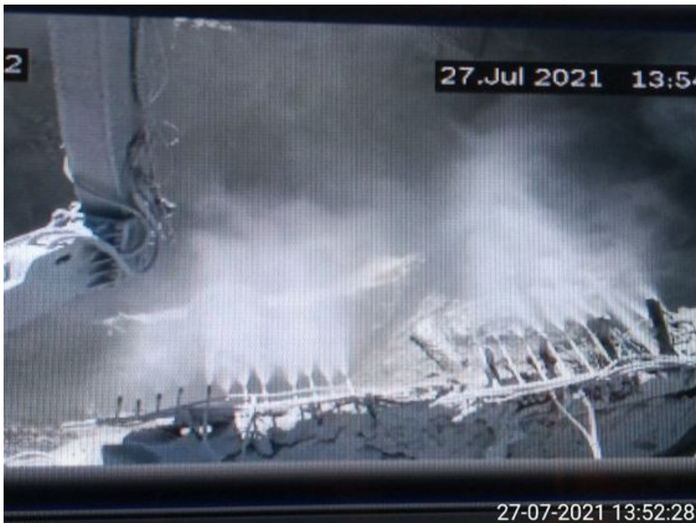
Foto 20: Medida: Supresor de polvo. Lugar: Taza Chancado 2. Comentarios: Supresores se observan operativos pero medida no es suficiente para mitigar material particulado en descarga de caex en taza de chancado