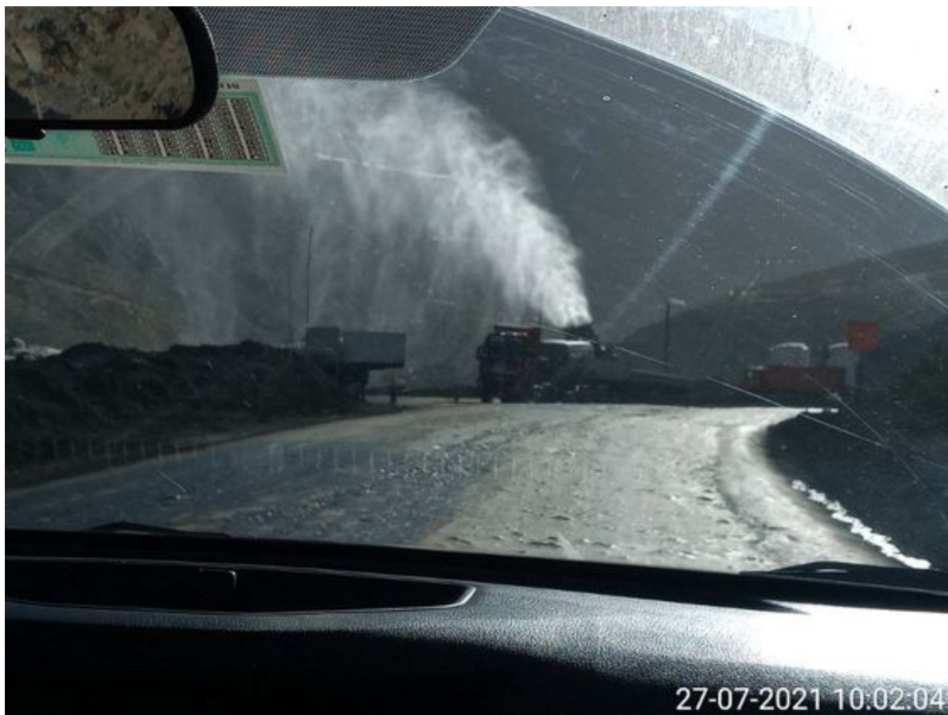
Foto 7: Medida: Fogcannon 1. Lugar: . Comentarios: equipo operativo