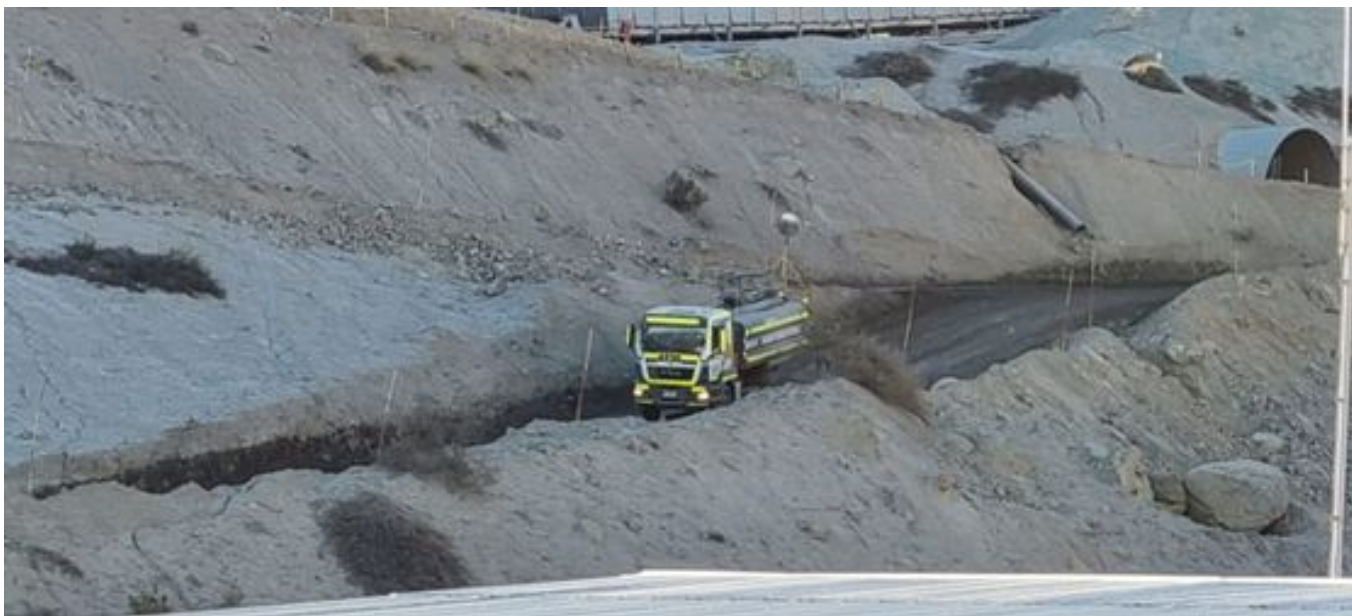
Foto 50: Medida: Riego Caminos. Lugar: Stock pile planta. Comentarios: riego de caminos operativo